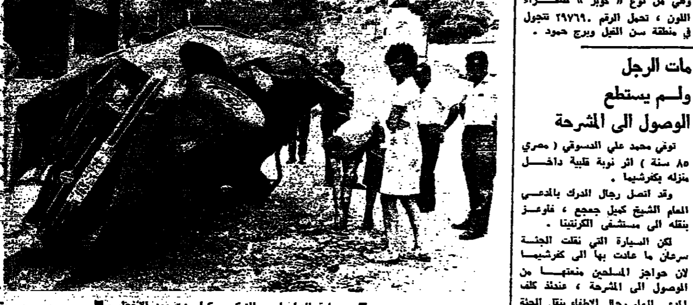
سيارة الدبلوماسي التركي كما كانت بعد التفجير